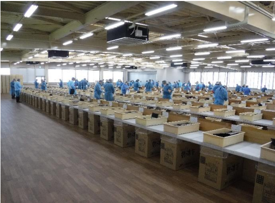
⑧ 人が密着しない様に海苔箱と海苔箱の間を空けての配列