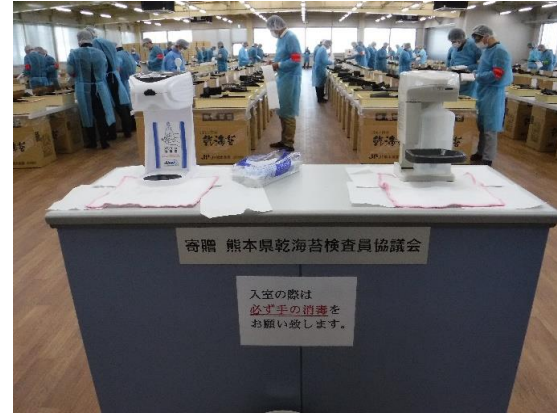
⑥ 手の消毒を行い入場