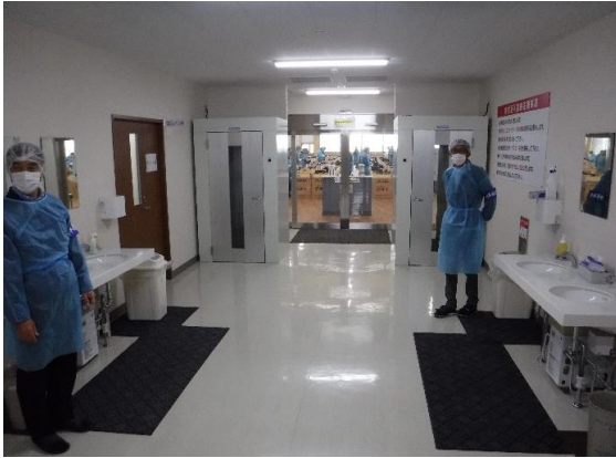
⑤ 殺菌剤配合の石鹼で手洗いをし見付場への入場