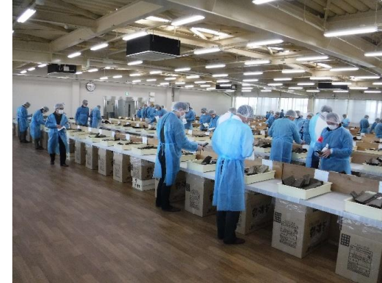
⑦ 指定商社は、帽子、マスク、ガウンを着用し見付を行いました